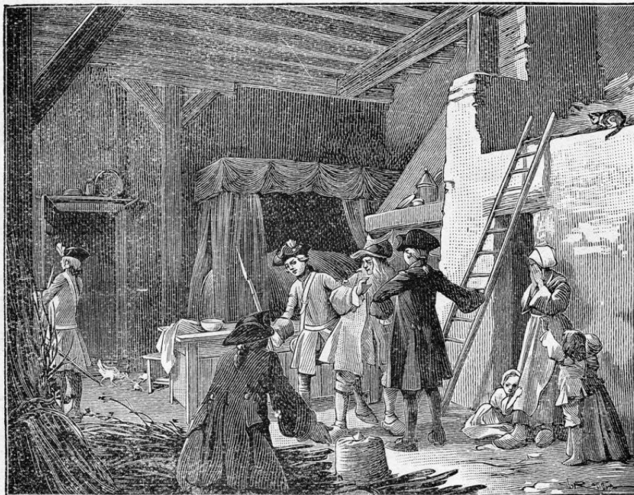
Des commis cherchent du sel de contrebande dans une maison sous Louis XV. Illustration anonyme tirée de l'« Histoire de France » par Ernest Lavis (1842-1922) vers 1920.

Dans notre province rédimée, le sel non taxé partait vers les pays de gabelle dans les fontes des faux-sauniers traqués par les gardes jusqu'en Indre-et-Loire, l'inverse n'avait pas lieu d'être. Nous retrouverons les faux-sauniers en partie 3.